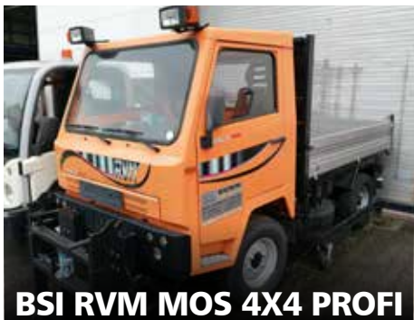
BSI RVM MOS 4X4 PROFII GEBRAUCHT