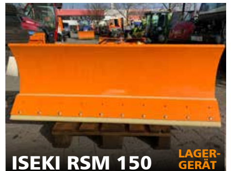
ISEKI RSM 150 LAGER- GERÄT