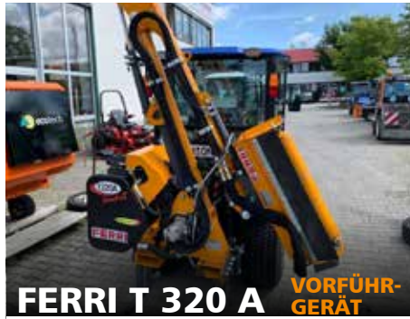
FERRI T 320 A VORFÜHR- GERÄT

Baujahr 2018, guter Zustand, max. waagrechte Reichweite 3,22 m