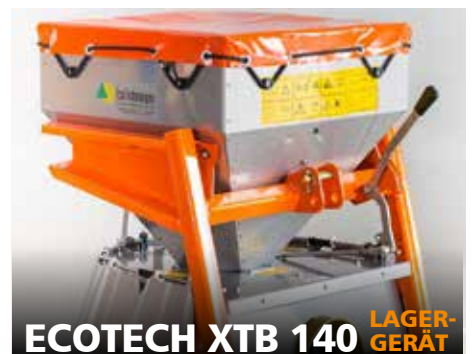
ECOTECH XTB 140 LAGER- GERÄT

Baujahr 2021, 120 L Füllvolumen (mit Aufsatz auf 210 L), Edelstahl