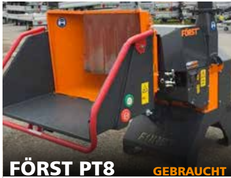
FÖRST PT8 GEBRAUCHT

UNSER TAGESAKTUELLES ANGEBOT FINDEN SIE IM INTERNET UNTER WWW.EDER-KOMMUNAL.DE