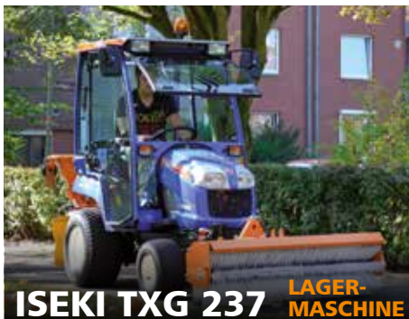
ISEKI TXG 237 LAGER- MASCHINE

Baujahr 2019, PS/kW 24/18, Steuergeräte ew/dw: 1/2, Unterbodenkonservierung