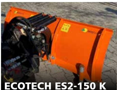
ECOTECH ES2-150 K GEBRAUCHT

Baujahr 2017, 1,50 m Arbeitsbreite (Auch Lagergeräte verfügbar)