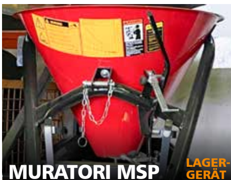
MURATORI MSP LAGER- GERÄT

Baujahr 2018, 150 L, Stahltrichter, verzinkter Streuteller, Streuflügel aus V2A (für Traktoren bis 50 PS geeignet)