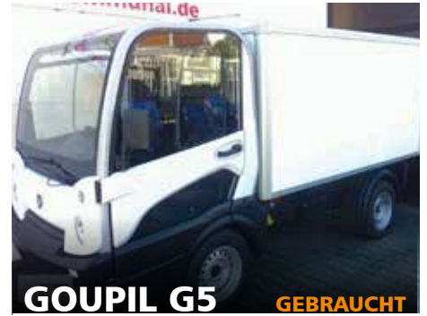
GOUPILO G5 GEBRAUCHT